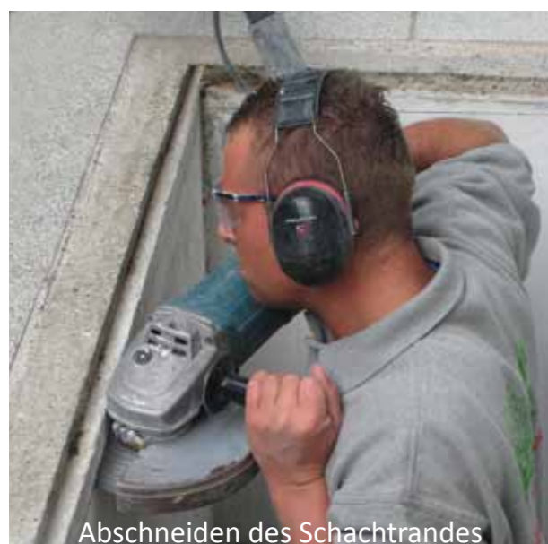
Abschneiden des Schachtrandes