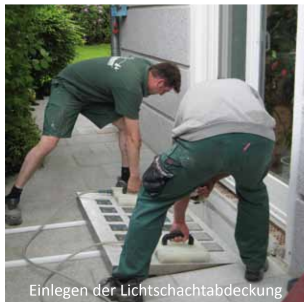
Einlegen der Lichtschachtabdeckung