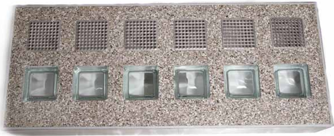
Die modasafe Lichtschachtabdeckung