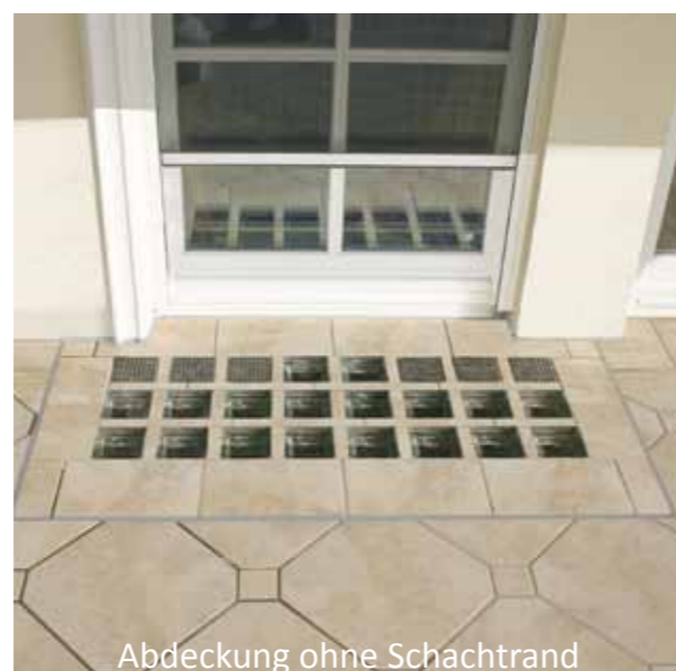
Abdeckung ohne Schachtrand