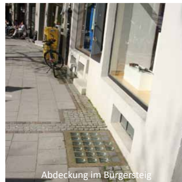
Abdeckung im Bürgersteig

Von großem Nutzen im öffentlichen Bereich