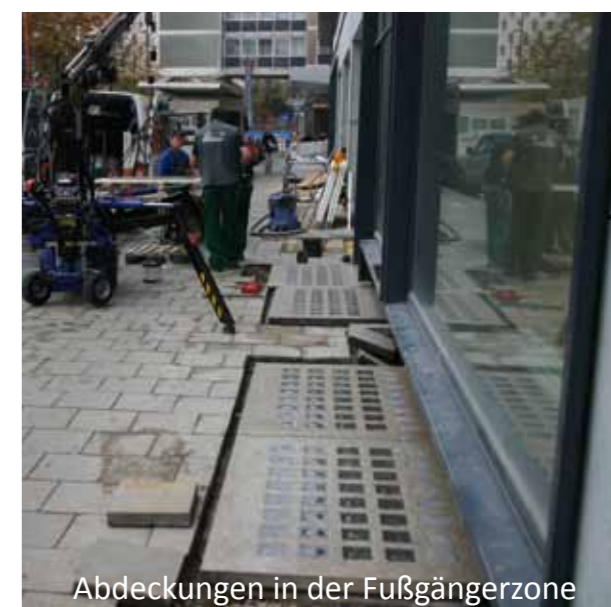
Abdeckungen in der Fußgängerzone

Ein Teil des Stadtbilds Auch im öffentlichen Bereich schafft eine modasafe Lichtschachtabdeckung großen Nutzen. Vor Geschäften, Büro- und öffentlichen Gebäuden sorgt eine modasafe Lichtschachtabdeckung für festen Stand, schützt vor Schmutz und Wasser im Schacht und dazu noch zuverlässig vor Einbrechern.