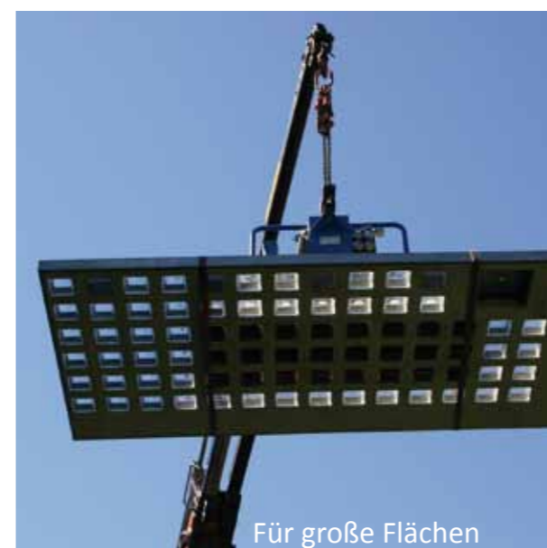
Für große Flächen

Handwerksbetrieb und Industrie modasafe ist auch Ihr Partner, wenn es um Schachtabdeckungen im Bereich Handwerk und Industrie geht. Aufgrund der enorm robusten und stabilen Konstruktion der modasafe Lichtschachtabdeckung können auch große Flächen sicher und funktionsgerecht abgedeckt werden.