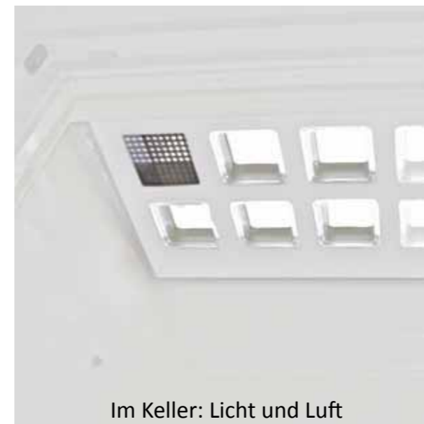
Im Keller: Licht und Luft