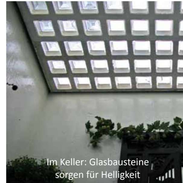
Im Keller: Glasbausteine sorgen für Helligkeit

Durch die Lüftungsgitter entsteht eine „Kaminwirkung“, mit der Lichtschächte trocken gehalten und Kellerräume dauerhaft erstklassig durchlüftet werden.